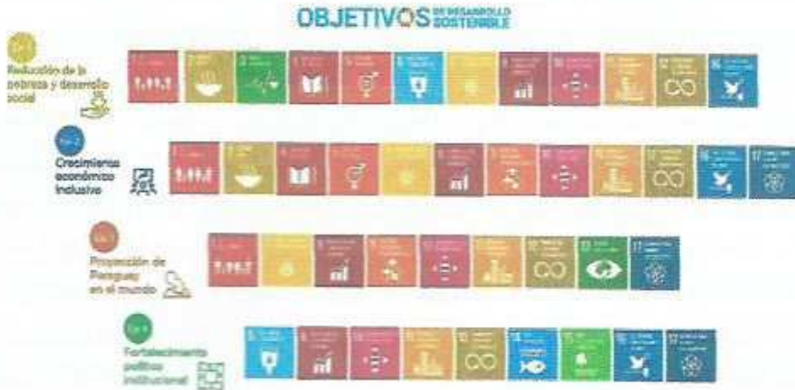
b. PLAN DESARROLLO DEPARTAMENTAL alineado y vinculado al PND Y ODS

Imagen: Vinculación de los ejes estratégicos del Plan de Desarrollo Departamental con el Plan Nacional de Desarrollo y los Objetivos de Desarrollo Sostenible.